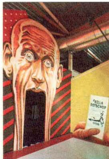
Entree van villa Rotschop.

Verspreid over het hele museum hangen tientallen beeldschermen waarop permanent de mooiste voetbalmomenten uit de geschiedenis zijn te zien. Maar veruit de beste plek om bewegende beelden te ondergaan is de filmzaal met een scherm